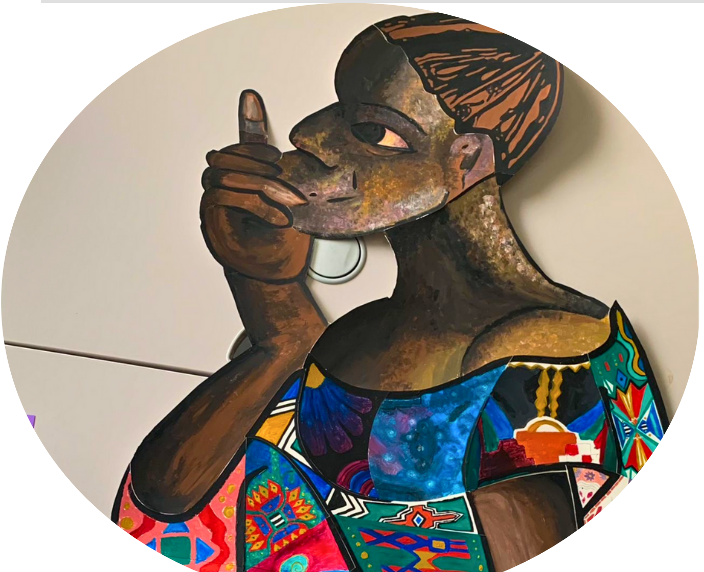
Eindresultaat kunstworkshop born in Africa